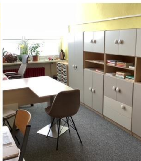
Kancelář speciálního pedagoga po výměně nábytku