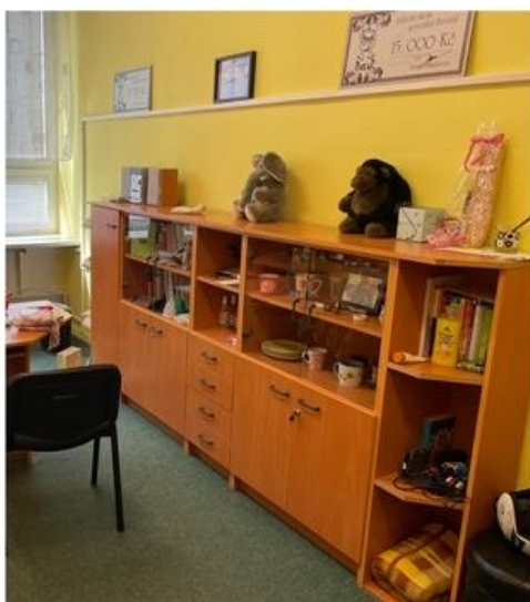
Kancelář speciálního pedagoga před výměnou