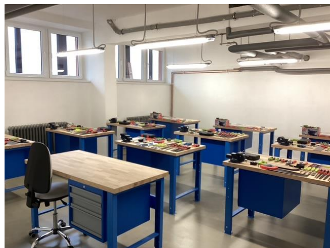
Foto původního stavu truhlářské dílny a výsledný stav po realizaci projektu.