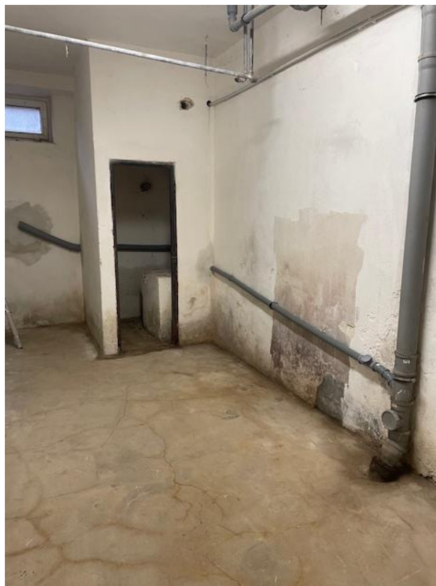
Foto vytvoření nového kanalizačního svodu z tzv. anglického dvorku hlavní budovy.