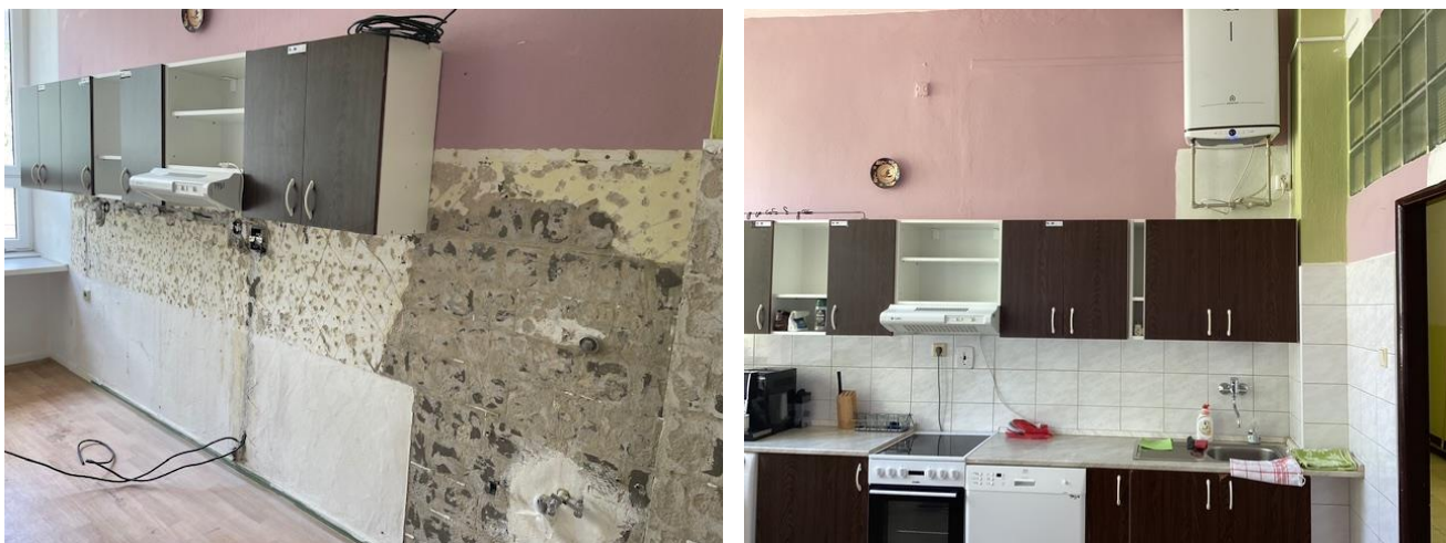
Foto žákovské kuchyňky na hlavní budově před a po rekonstrukci.

ZÁKLADNÍ ŠKOLA Bruntál, Rýmařovská 15 , příspěvková organizace disponuje třemi budovami, které jsou majetkem Moravskosleského kraje. Všechny budovy pochází ze 70. let, a přestože od roku 2005 došlo k vnější celkové rekonstrukci spočívající ve výměně oken, zateplení budov a pořízení nových střech, vnitřní opotřebení budov vyžaduje neustálou, průběžnou údržbu a modernizaci. V roce 2025 došlo k modernizaci obou žákovských kuchyněk, na hlavní budově se podařilo zkvalitnit elektroinstalaci, dokončit výměnu úsporných zářivek ve všech místnostech. Dále byly provedeny hydroizolační práce z důvodu vztlínající spodní vody a špatného stavu kanalizace v suterénu hlavní budovy.